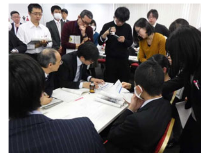
県と市による支援要請書のやりとり