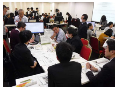
グループワーク実施の様子