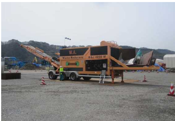
M &amp; J4000

出典 4：メーカーが提示する処理能力を記載。処理能力は対象物の種類によって変動することもある。