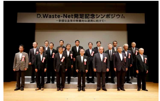
図1 D.Waste-Net 発足記念シンポジウムの様子

環境省は、災害廃棄物対策に関してこれまで得られた知見・技術を有効に活用し、我が国の災害廃棄物対応力を向上させるため、環境大臣が災害廃棄物対策のエキスパートとして任命した有識者、技術者、業界団体等で構成される「災害廃棄物処理支援ネットワーク（D.Waste-Net）」（以下「D.Waste-Net」という）を構築した。平成27年9月16日に発足式を行い、構成メンバーには大臣名で任命証書を発行し、活動を開始した。