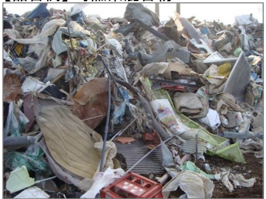
【品目例】可燃系混合物