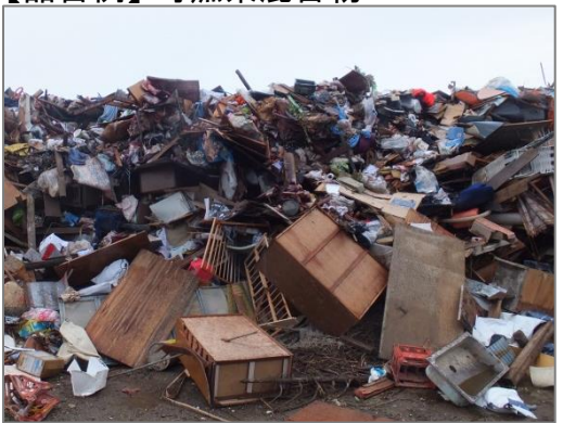
【品目例】可燃系混合物