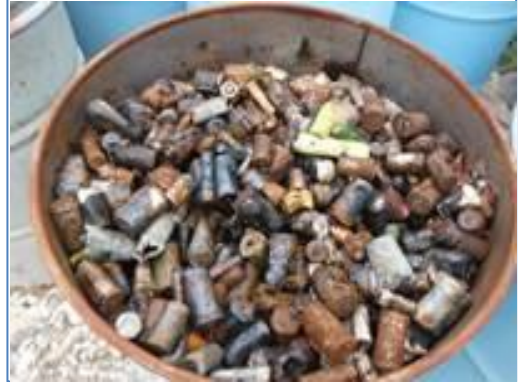
【品目例】乾電池・リチウム電池類

※ 腐食による液漏れ防止のため、容器で保管した方が良い (容器は蓋付きが望ましい。)