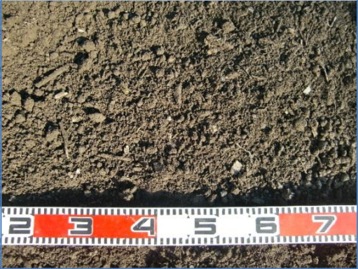
【品目例】 ふるい下くず