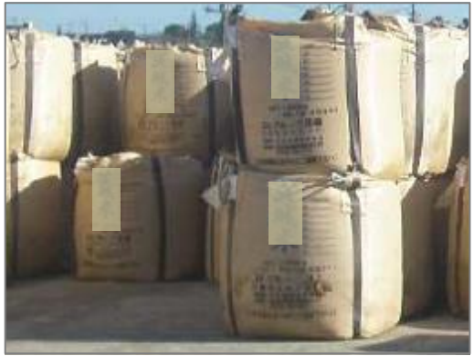
【品目例】 農林・畜産廃棄物:(収穫米)