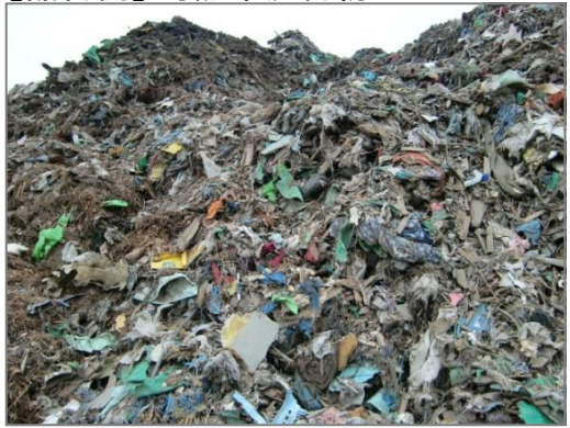
【品目例】可燃系混合物