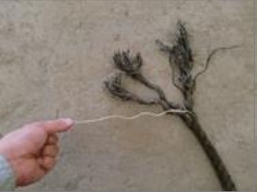
【品目例】 鉛入ロープ類