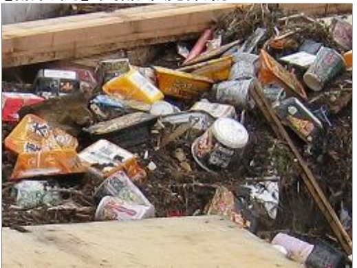
【品目例】 食品系廃棄物