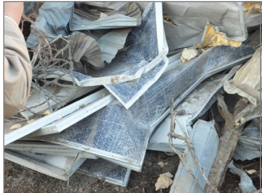
【品目例】太陽光パネル