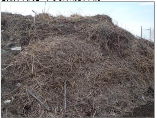
【品目例】木質系混合物