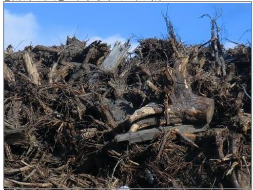
【品目例】木質系混合物