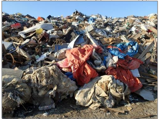
【品目例】可燃系混合物:(シート類)