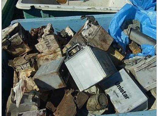
【品目例】バッテリー類

※ 腐食による液漏れ防止のため、容器で保管した方が良い (容器は蓋付きが望ましい。)