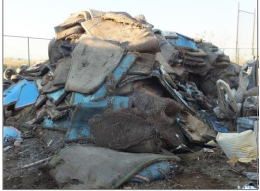
【品目例】 廃畳類：(腐敗が進行した例)