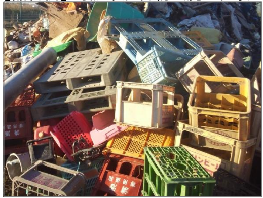
【品目例】可燃系混合物:(廃プラ等)