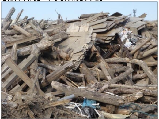
【品目例】木質系混合物