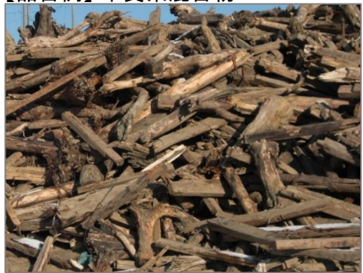
【品目例】木質系混合物