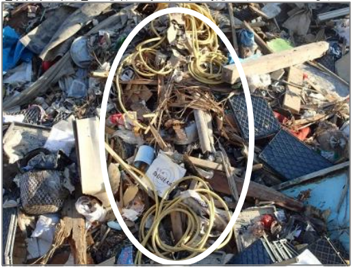
【品目例】可燃系混合物:(コード等)