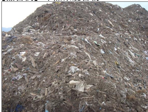
【品目例】 不燃系混合物