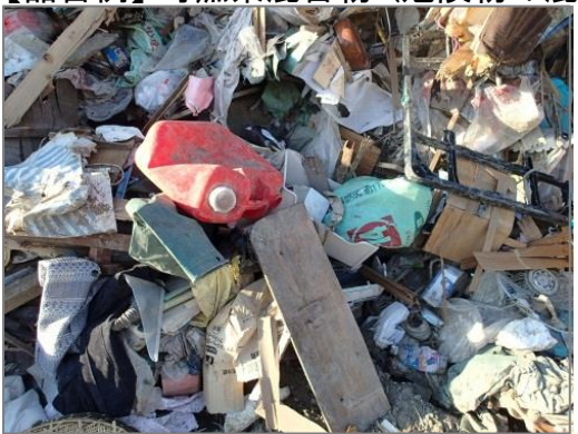
【品目例】可燃系混合物:(危険物の混入)