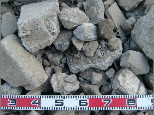
【品目例】 コンクリートがら