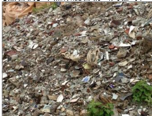
【品目例】 不燃系混合物:(陶器等)