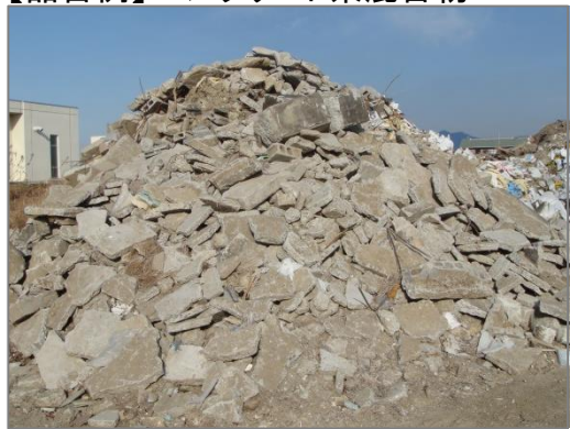
【品目例】コンクリート系混合物