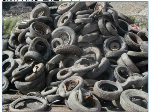
【品目例】 普通タイヤ