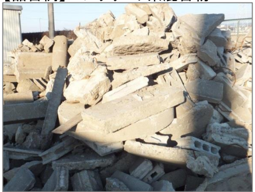
【品目例】コンクリート系混合物