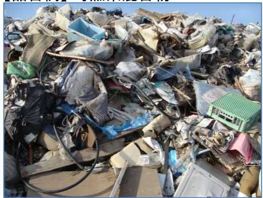
【品目例】可燃系混合物