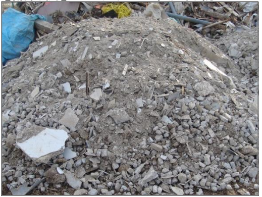
【品目例】コンクリート系混合物