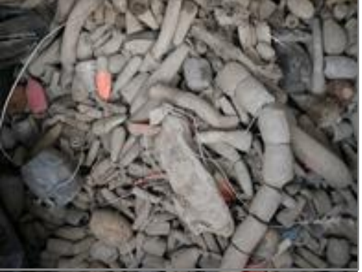
【品目例】 鉛(漁具・魚網から除去したもの)