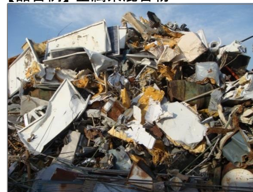
※ スチール家具が主体の混合物