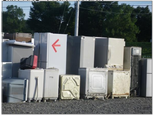
【品目例】 冷蔵庫・洗濯機

※ 家電リサイクル法に基づき処理 ※ 破損品はリサイクル不可のため取扱注意 ※ 腐敗防止のため庫内の生鮮品等は除去 ※ 家電リサイクル券の貼付のため、品目、寸法、メーカー毎に整理が必要