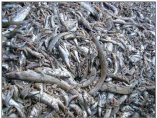
【品目例】 水産廃棄物