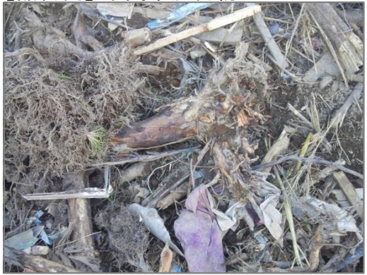
【品目例】木質系混合物