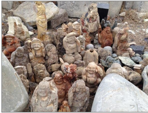
【品目例】 その他の処理困難物 (仏像・縁起物等)