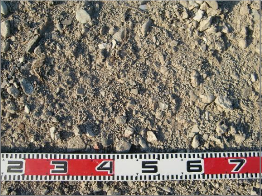
【品目例】 ふるい下くず