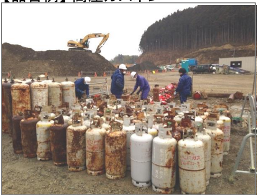
【品目例】高圧ガスボンベ