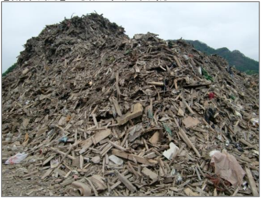
【品目例】可燃系混合物