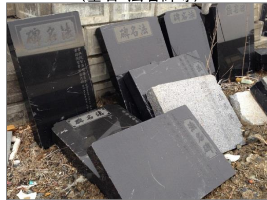
【品目例】 その他の処理困難物 (墓石・法名碑等)