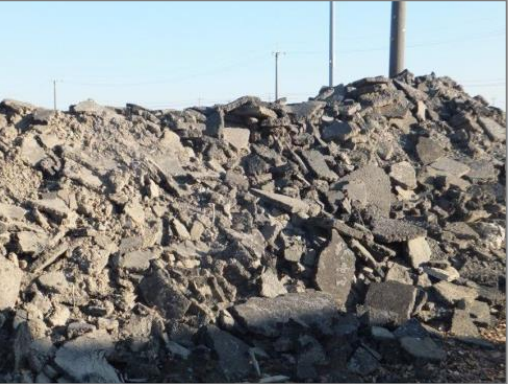
【品目例】 アスファルトがら