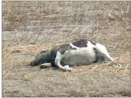
【品目例】 農林・畜産廃棄物:(死亡獣畜)