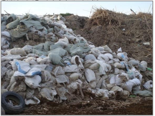
【品目例】木質系混合物