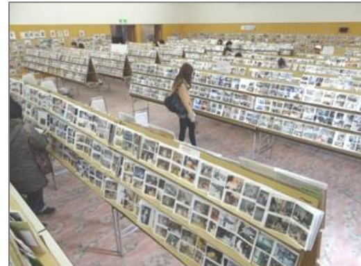
【品目例】思い出の品等、貴重品等