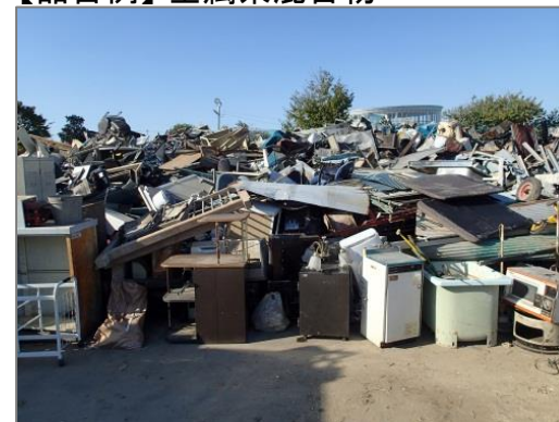
※ スチール家具が主体の混合物