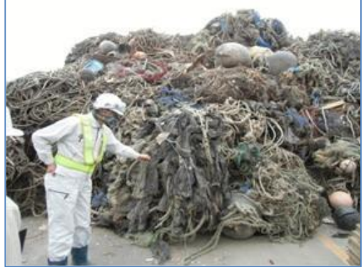
【品目例】 漁具・漁網・鉛入りロープ類

※ 鉛が編み込まれた物は、焼却すると焼却灰中の鉛濃度が管理値を超えてしまうため、選別が必要