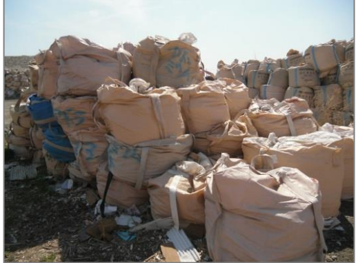
【品目例】 廃石膏ボード

※ 鉛が編み込まれた物は、焼却すると焼却灰中の鉛濃度が管理値を超えてしまうため、選別が必要