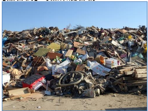
【品目例】可燃系混合物