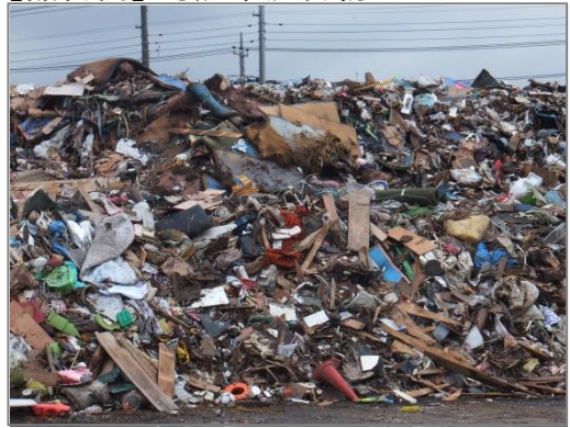
【品目例】可燃系混合物