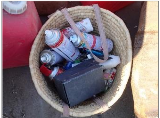
【品目例】その他 危険物・有害物 (ガスボンベ)