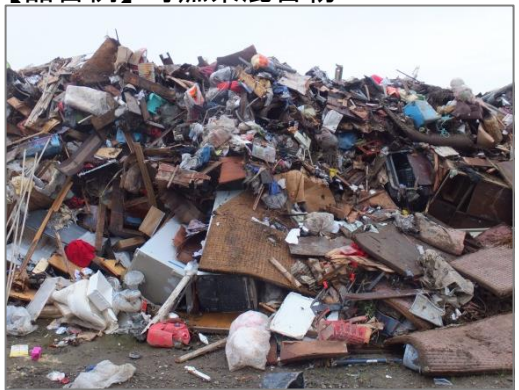
【品目例】可燃系混合物