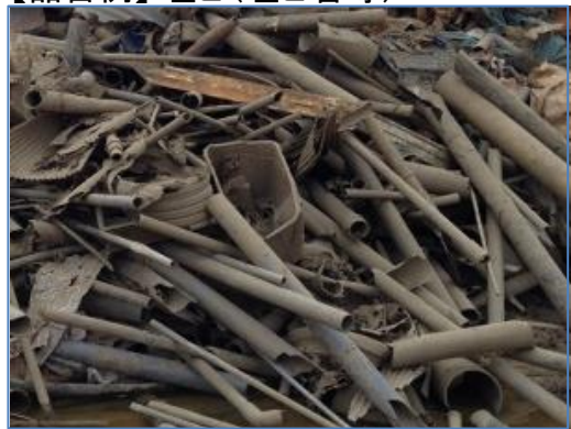
【品目例】 塩ビ(塩ビ管等)