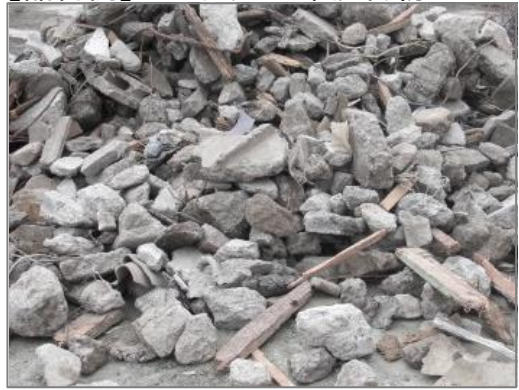
【品目例】コンクリート系混合物