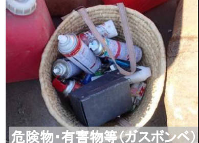
危険物・有害物等(ガスボンベ)