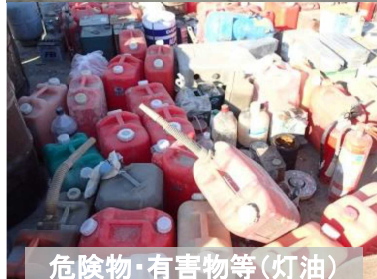
危険物・有害物等(灯油)