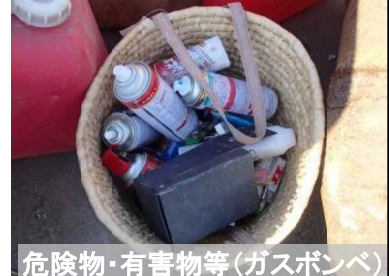
危険物・有害物等(ガスボンベ)