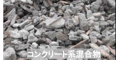
コンクリート系混合物