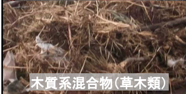
木質系混合物(草木類)