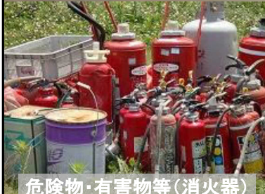
危険物・有害物等(消火器)