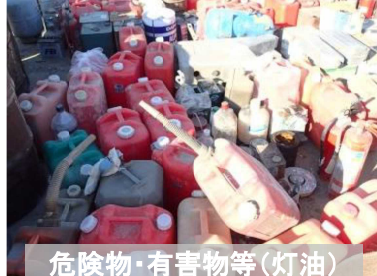
危険物・有害物等(灯油)