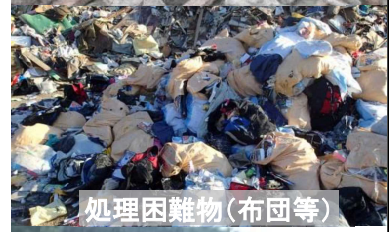
処理困難物(布団等)