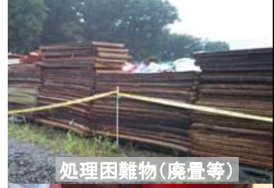
処理困難物(廃畳等)