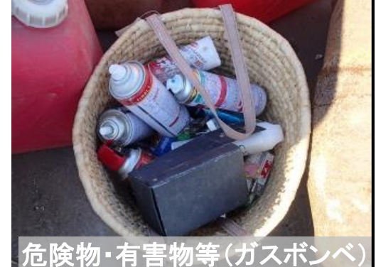
危険物・有害物等(ガスボンベ)