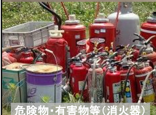
危険物・有害物等(消火器)