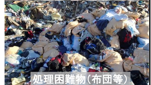
処理困難物(布団等)