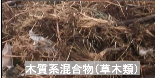
木質系混合物(草木類)