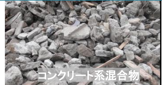
コンクリート系混合物