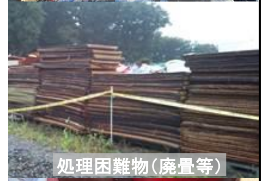
処理困難物(廃畳等)