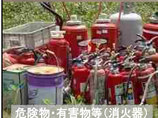
危険物・有害物等(消火器)