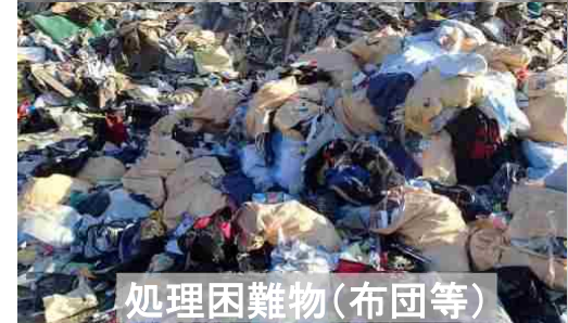
処理困難物(布団等)