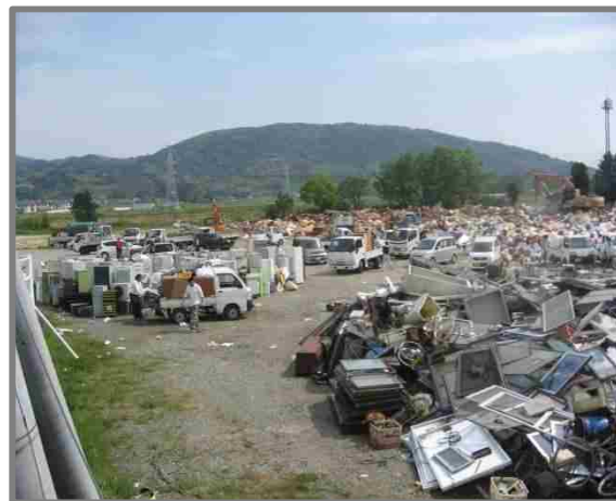
益城町仮置場(全景)