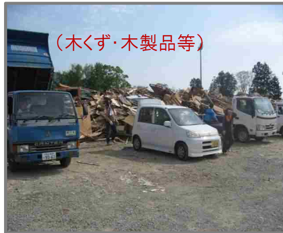
住民による仮置場への搬入状況