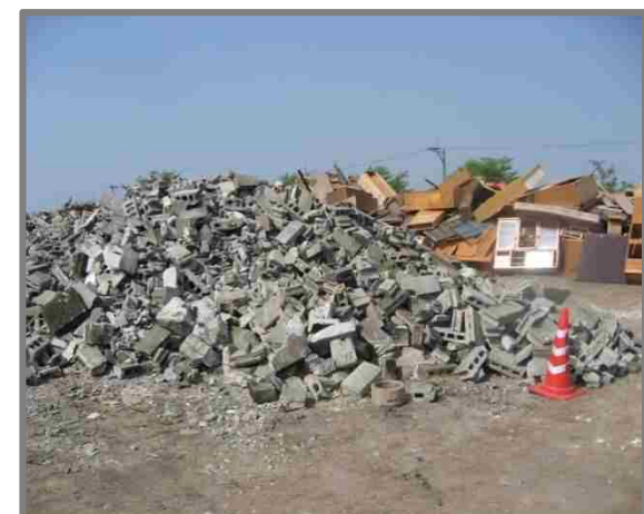
仮置状況(コンクリートブロック)