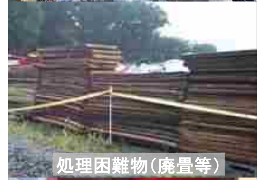
処理困難物(廃置等)