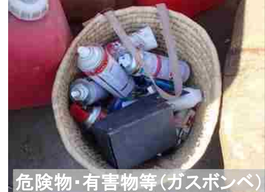
危険物・有害物等(ガスボンベ)