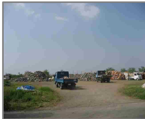
嘉島町仮置場(全景)