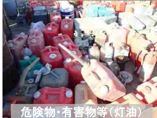
危険物・有害物等(灯油)