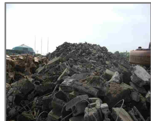
仮置状況(コンクリートブロック)