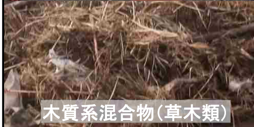
木質系混合物(草木類)