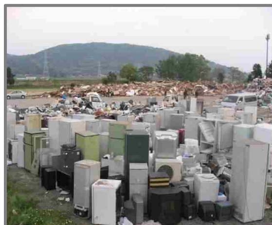
仮置状況(家電4品目)