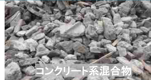
コンクリート系混合物