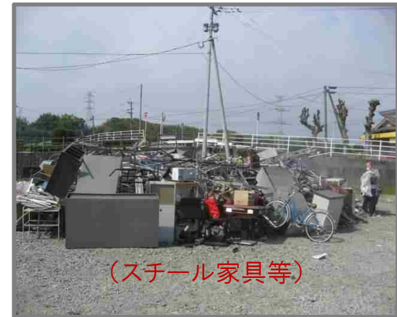
仮置状況(金属製品)