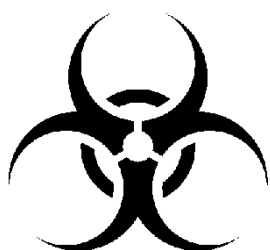
バイオハザードマーク