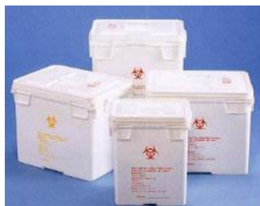
感染性廃棄物の容器の例

※ 感染性廃棄物を収納した容器には、関係者が識別できるよう、感染性廃棄物であることを明記することとなっていますが、必ずしもバイオハザードマークが付いているとは限りません。