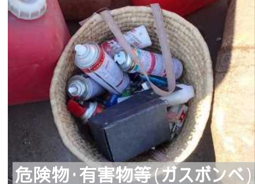
危険物・有害物等(ガスボンベ)