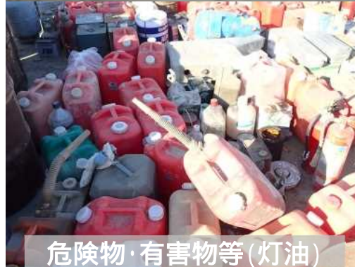
危険物・有害物等(灯油)