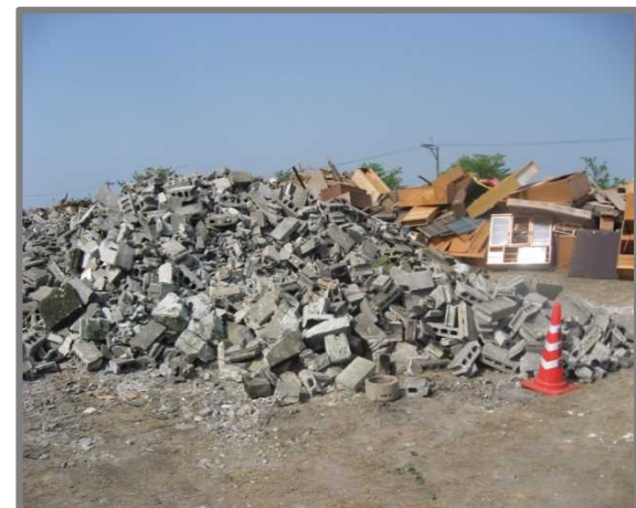
仮置状況(コンクリートブロック)