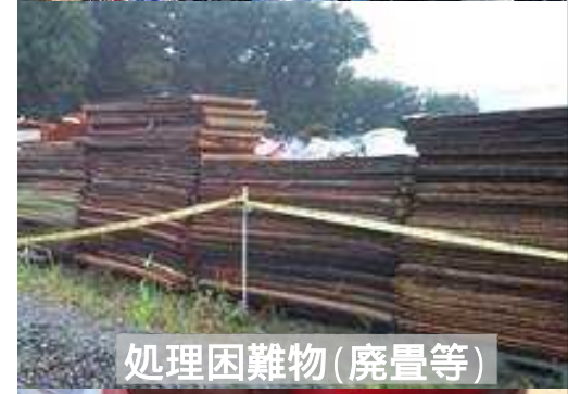
処理困難物(廃畳等)