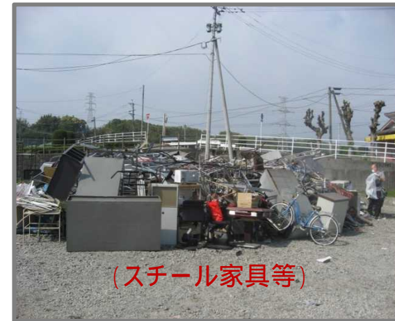
仮置状況(金属製品)