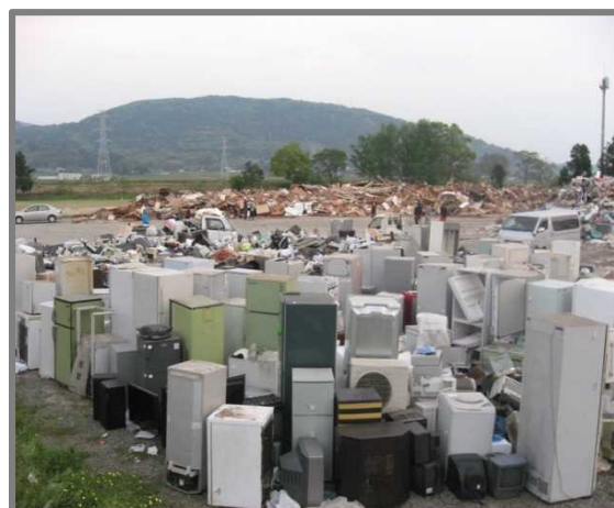
仮置状況(家電4品目)