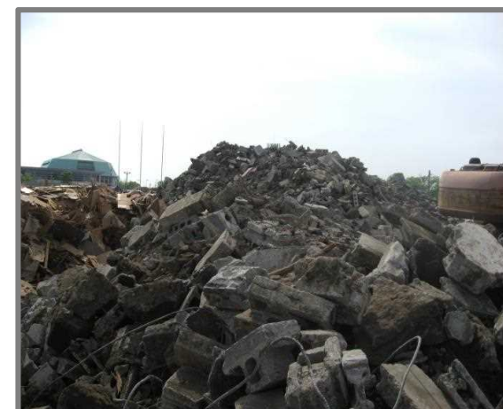
仮置状況(コンクリートブロック)