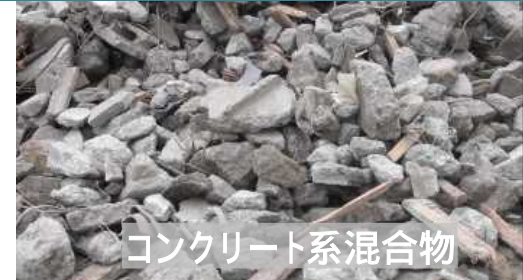
コンクリート系混合物