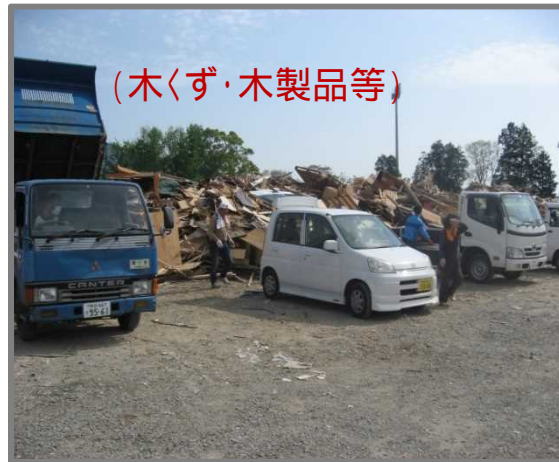
住民による仮置場への搬入状況