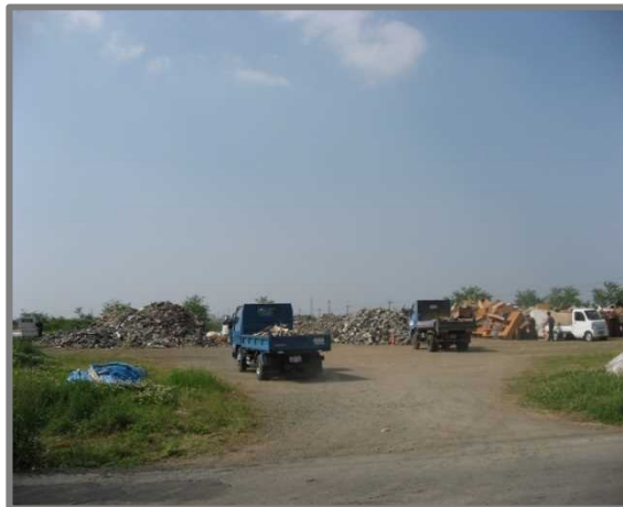
嘉島町仮置場(全景)