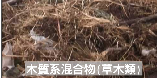
木質系混合物(草木類)