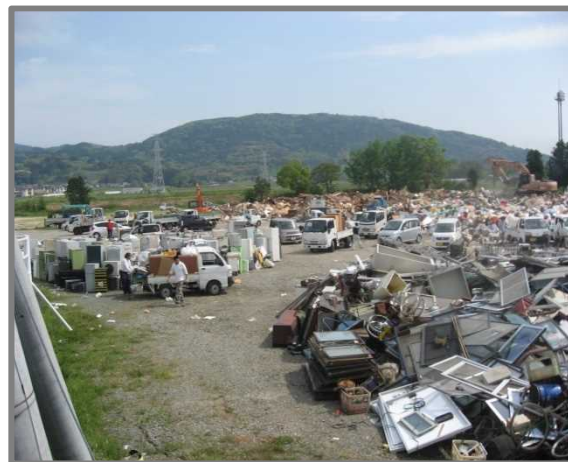
益城町仮置場(全景)