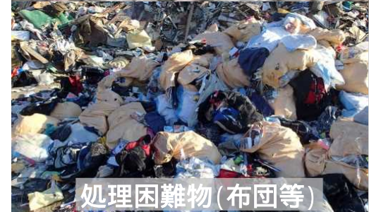
処理困難物(布団等)