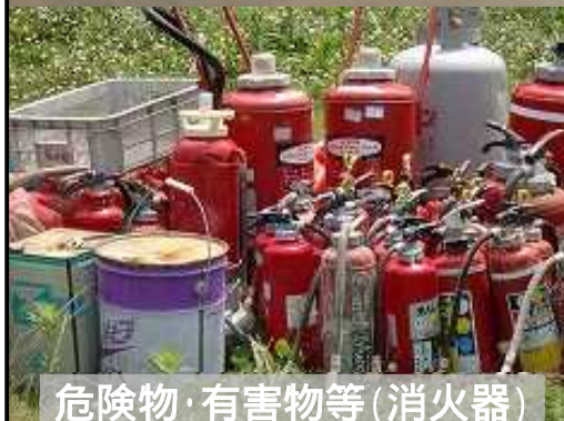
危険物・有害物等(消火器)