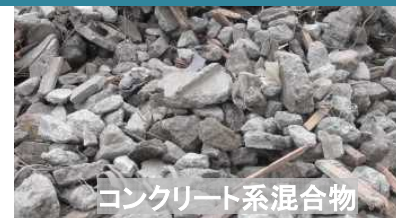
コンクリート系混合物