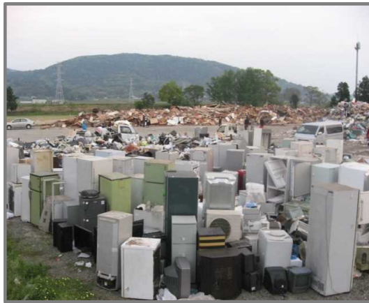
仮置状況(家電4品目)