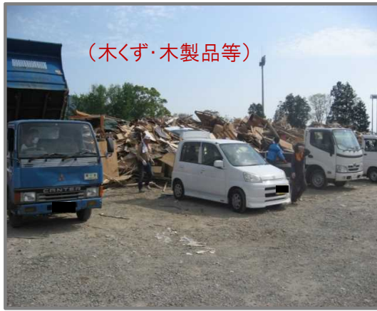
住民による仮置場への搬入状況