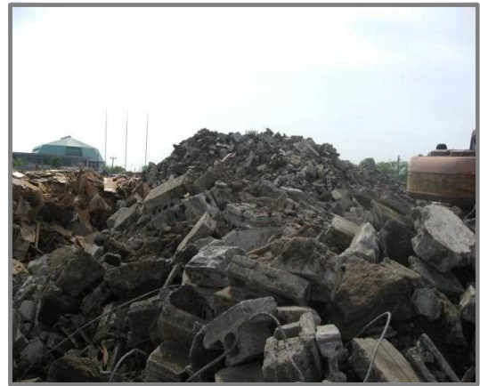
仮置状況(コンクリートブロック)