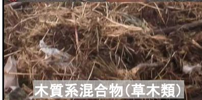
木質系混合物(草木類)