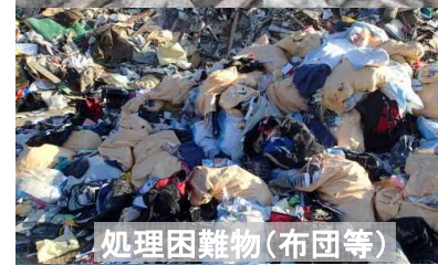
処理困難物(布団等)