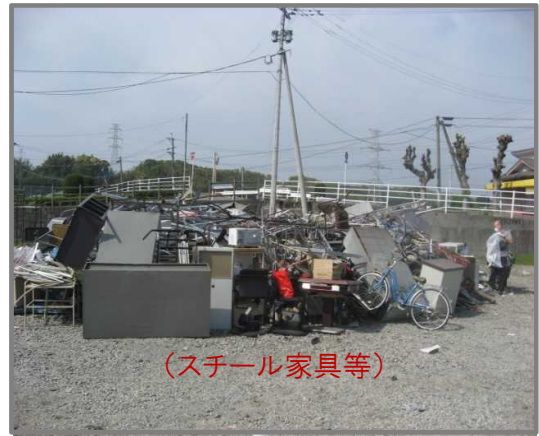
仮置状況(金属製品)