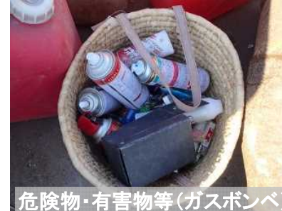
危険物・有害物等(ガスボンベ)