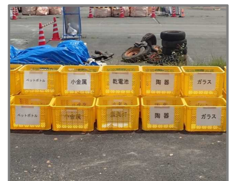
小物分別用ボックス