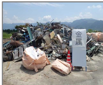
分別状況(金属くず)