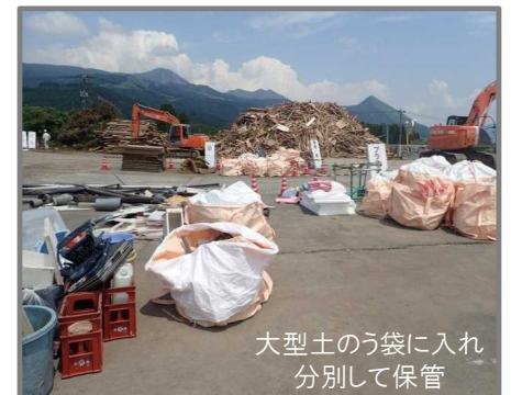
分別状況(プラスチック、塩ビ等)