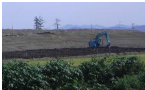
岩手県野田村の都市公園事業整備工事