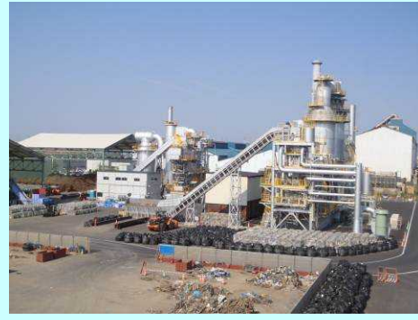
宮城東部ブロックの仮設焼却炉（2基） (1号炉 H24.10.12 本格運転開始 2号炉 10.11 性能試験済み)